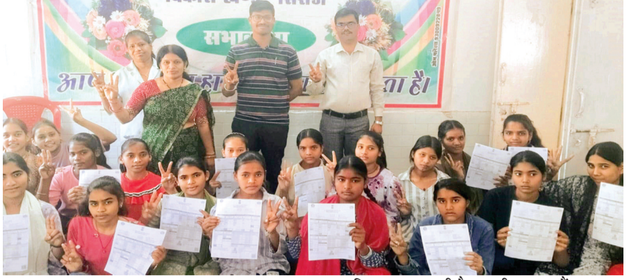
हरिभूमि न्यूज ►► सिरोंज

भारत सरकार द्वारा गर्भाशय ग्रीवा कैंसर को रोकथाम के लिए 14 वर्ष की बालिकाओं के लिए देशव्यापी एचपीवी टीकाकरण अभियान शुरू किया गया है। प्रधानमंत्री द्वारा शुरू किया गया यह अभियान 3 महीने तक चलेगा। जिसका उद्देश्य बालिकाओं को कैंसर से सुरक्षा प्रदान करना और स्वस्थ नारी विज्ञान को आगे बढ़ाना है। तो वही स्वास्थ्य विभाग की टीम द्वारा शासकीय कस्टरवा गांधी बालिका छात्रावास की बालिकाओं को वैक्सीन लगाई गई।