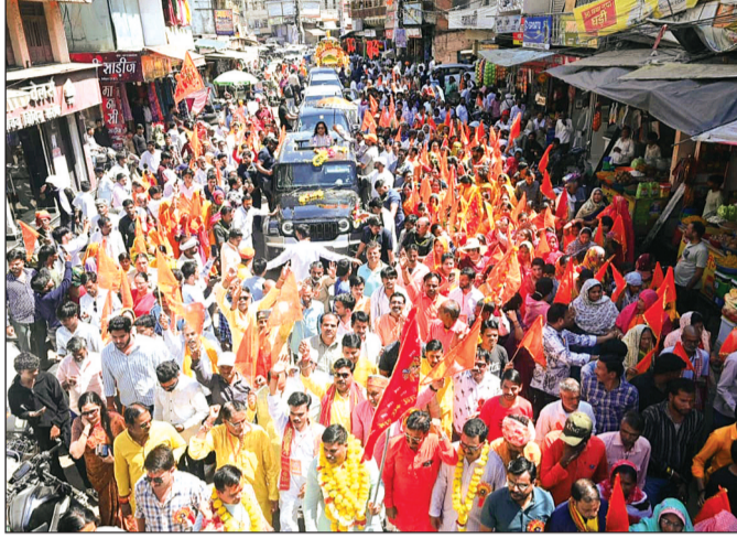
विदिशा। माधवगंज से निकाली गई सनातन एकता यात्रा में सैकड़ों की संख्या में शहर के लोग हुए शामिल।