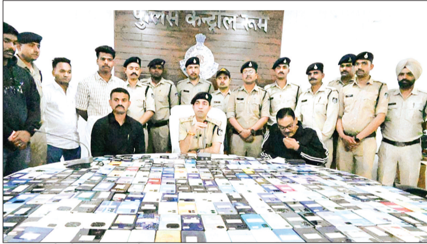
विदिशा। मग ही नहीं अन्य राज्यों से भी पुलिस ने लोगों के गुम हुए मोबाइल बरामद कर वास्तविक मालिकों को सौंपे।

विदिशा पुलिस द्वारा संचालित मिशन मोबाइल रिकवरी अभियान के अंतर्गत गुम एवं चोरी हुए मोबाइल फोन बरामद कर उन्हें उनके वास्तविक मालिकों तक पहुंचाया जा रहा है। मंगलवार को पुलिस ने बरामद मोबाइलों को लेकर पत्रकार वार्ता की। इसी दौरान कई लोगों को उनके मोबाइल लौटाए गए। इससे पहले भी पुलिस सैकड़ों लोगों को उनके गुम हुए मोबाइल लौटा चुकी है। आधुनिक तकनीक और समन्वित प्रयासों के चलते पुलिस को इस अभियान में बड़ी सफलता मिल रही है। फरवरी 2026 के दौरान जिले के विभिन्न थाना क्षेत्रों