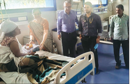
हरिभूमि न्यूज ►► बरेली

सरल महिला विकास समिति द्वारा प्रतिमाह सिविल अस्पताल पहुंचकर भरती प्रसूता महिलाओं कुपोषित बच्चों को फूड किट एवं वस्त्र का वितरण कर सराहनीय सेवा कार्य किया जा रहा है।