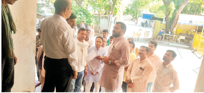
हरिभूमि न्यूज ►► सिरोंज

जिले में बिना सुपर स्ट्रॉ मैनेजमेंट सिस्टम युक्त हार्वेस्टर से फसल कटाई पर प्रतिबंध लगाने और दंडात्मक कार्रवाई के आदेश के खिलाफ सिरोंज में किसानों का आक्रोश सामने आने लगा है।