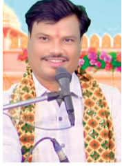
हरिभूमि न्यूज ►► सिरोंज